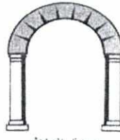
مدينة الناظور باب أروبا