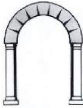
مدينة الناظور باب أوروبا

المملكة المغربية وزارة الداخلية إقليم الناظور جماعة الناظور